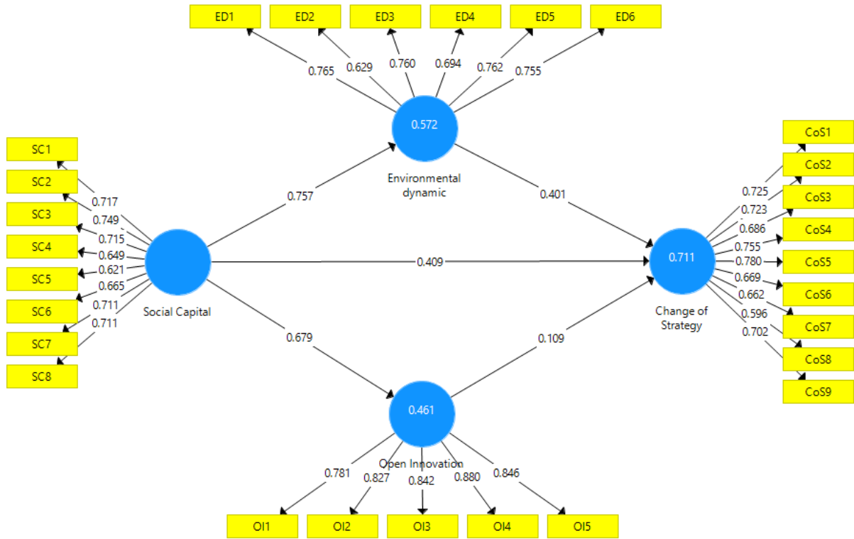
شکل 2. ضریب مسیر

اعداد داخل دایره شاخص ضریب تعیین می‌باشند. ضریب تعیین ( R^2 ) بررسی می‌کند چند درصد از واریانس یک متغیر وابسته توسط متغیر (های) مستقل تبیین می‌شود؛ بنابراین طبیعی است که این مقدار برای متغیر مستقل مقداری برابر صفر و برای متغیر وابسته مقدار بیشتر از صفر باشد. هر چه این میزان بیشتر باشد، ضریب تأثیر متغیرهای مستقل بر وابسته بیشتر می‌باشد؛ بنابراین می‌توان گفت که متغیر مستقل روی هم رفته توانسته اند از واریانس متغیر وابسته را تبیین کنند.