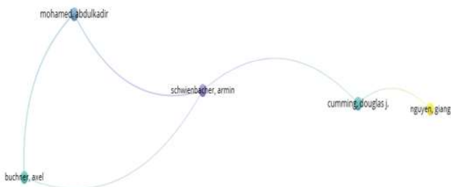
شکل 5. تحلیل نویسندگی

با لحاظ کردن میزان استناد های انجام شده و میزان فعالیت نویسندگان در حوزه بیان معیارهای انتخاب شریک و سرمایه گذار در کسب و کارهای نوپا، به دو خوشه با مشخصات شکل زیر رسیدیم: