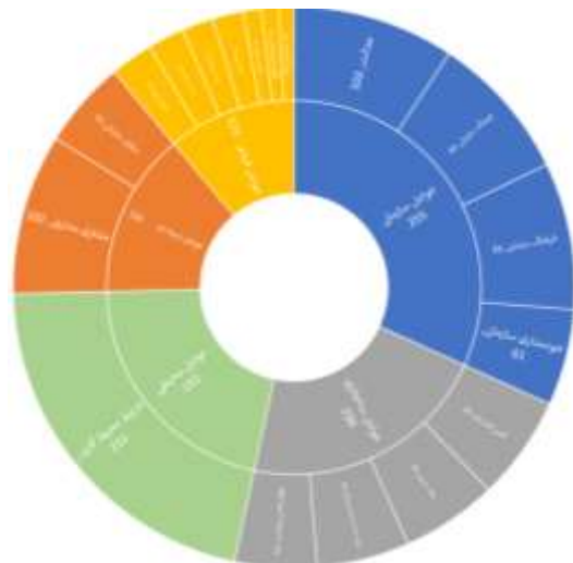
شکل ۲- مدل ارزشیابی اخلاق سازمانی

با رتبه بندی شاخص های مؤثر بر ارزشیابی اخلاق سازمانی و مقایسه زوجی زیرمعیارها مدل ارزشیابی اخلاق سازمانی به شکل ذیل می باشد. همچنین مدل نهایی ارزشیابی اخلاق سازمانی در شکل ۲، نشان داده است.